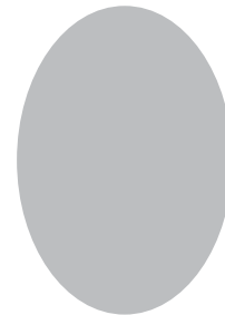
Tamaño credencial (3.5 X 5 cm)

Importante | No se recibirán fotografías que no cumplan con estos requisitos